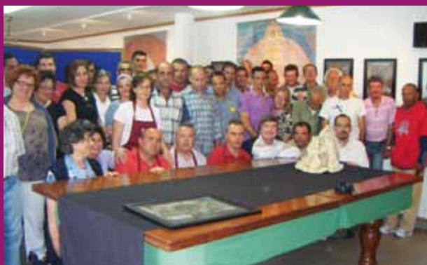
Membros da Comunidade Vida e Paz e elementos da Direcção da AAT num retrato após o almoço

A AAT foi visitada por um grupo de 24 pessoas da Associação de Reformados da Imprensa Nacional – Casa da Moeda e por um outro grupo, constituído por 50 pessoas, da Comunidade Vida e Paz, nos